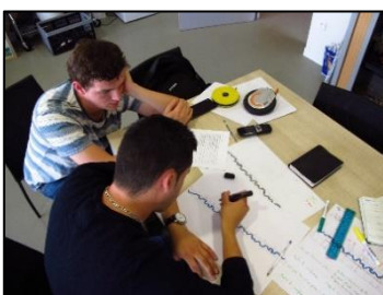
Développement de projets / accompagnement technique