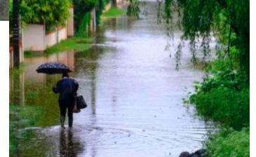
Prévention des inondations