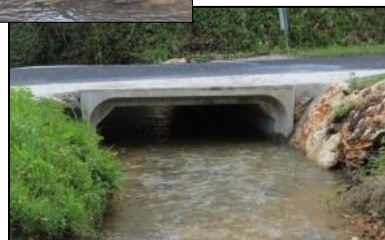
Travaux sur les ouvrages hydrauliques