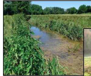
Travaux de restaurations