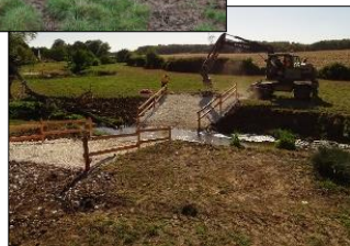
Mise en défens / protection des milieux