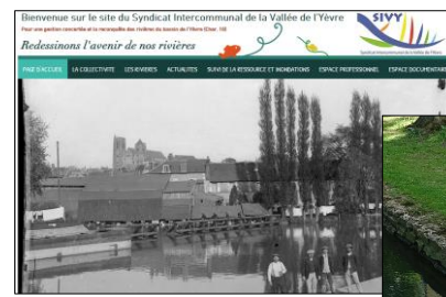
Actions de communications / sensibilisation à l'environnement